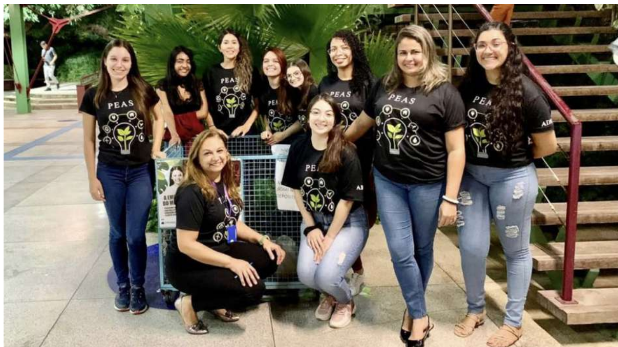
Projeto Cata Treco Traz Felicidade

A equipe do projeto está com um ponto de coleta no pátio do bloco A – campus Lagoa Seca, onde a comunidade acadêmica e público geral podem descartar seu lixo eletrônico.